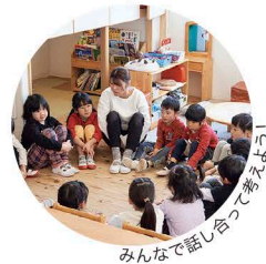
みんなで話し合っ て考えよう