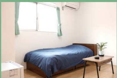
レイモンドハウス