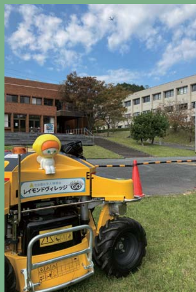
レイモンドマネジメント