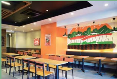
バーガーキング（レイモンドBK）