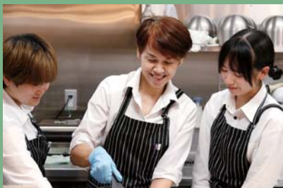
さかい珈琲（レイモンドマーケット）