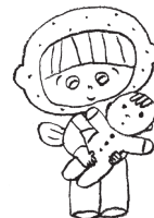
レイモンド川崎保育園