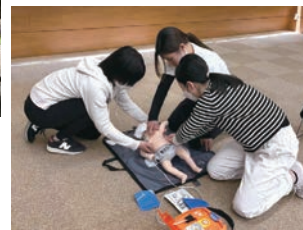
れもんご草津保育園