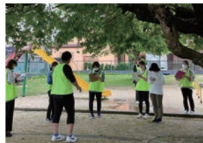
レイモンド東矢倉保育園

子どもたちのかけがえのない命を守り、育んでいくために、今年も全施設にてお散歩コースの見直しや救命訓練などを行いました。